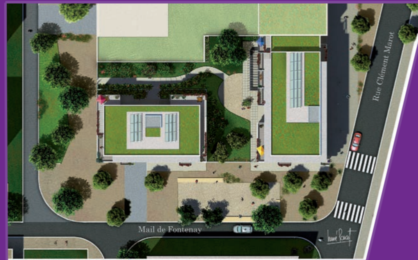
Plan masse de l'opération