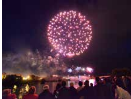
Feux d'artifices en bords de Loire