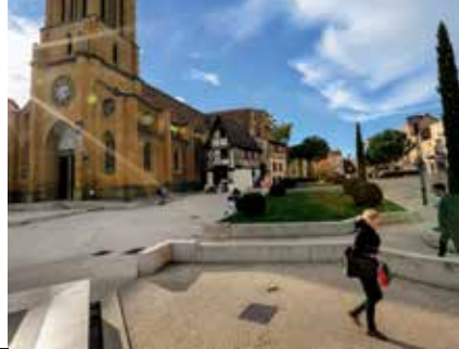
Centre ancien de Roanne