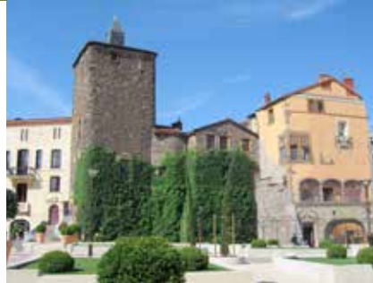
Maison du Tourisme Roannais