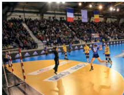
Match de hand-ball féminin France-Roumanie