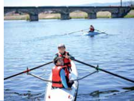
Aviron sur la Loire