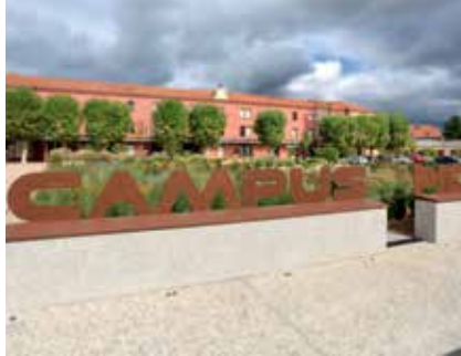
↳ Campus universitaire Pierre Mendès France