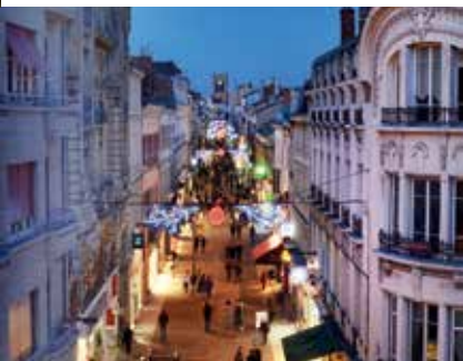
Illuminations Rue Charles de Gaulle