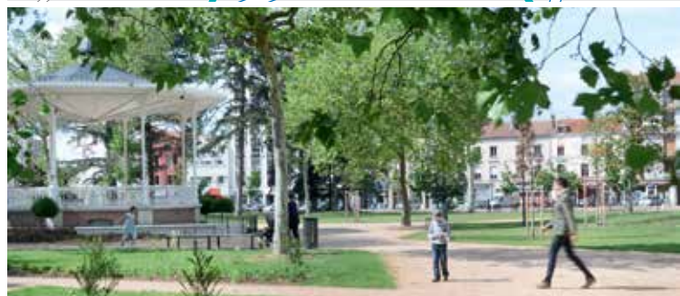
Le kiosque de la Place des Promendes