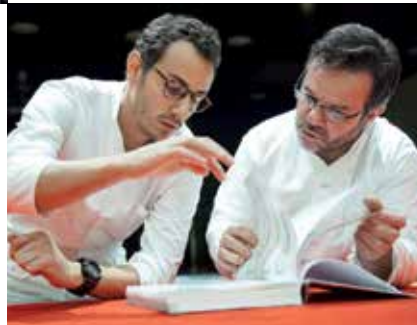
Michel et César Troisgros