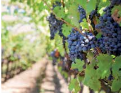
Le côte-roannaise (AOC - appellation d'origine contrôlée)