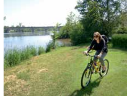
↳ Promenade à vélo en bords de Loire