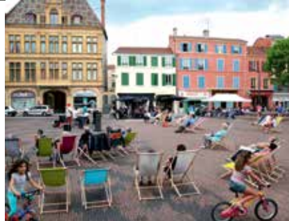
↳ Les Jeudis Live