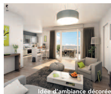
Idee d'ambiance décorée

Enfin, les parkings et les garages font partie des avantages indéniables de votre future résidence.