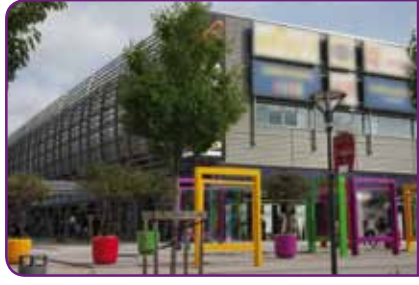
Carré de Sole.