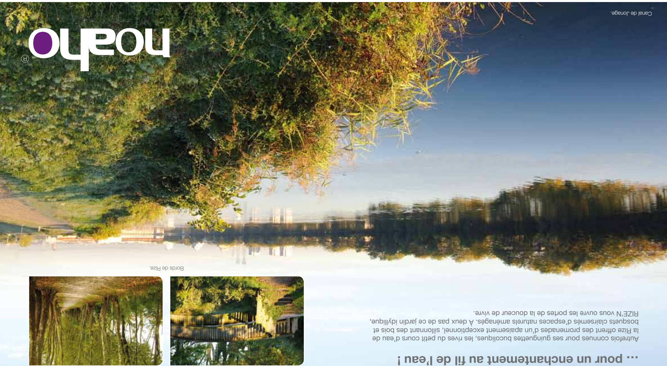
Canal de Jonage.