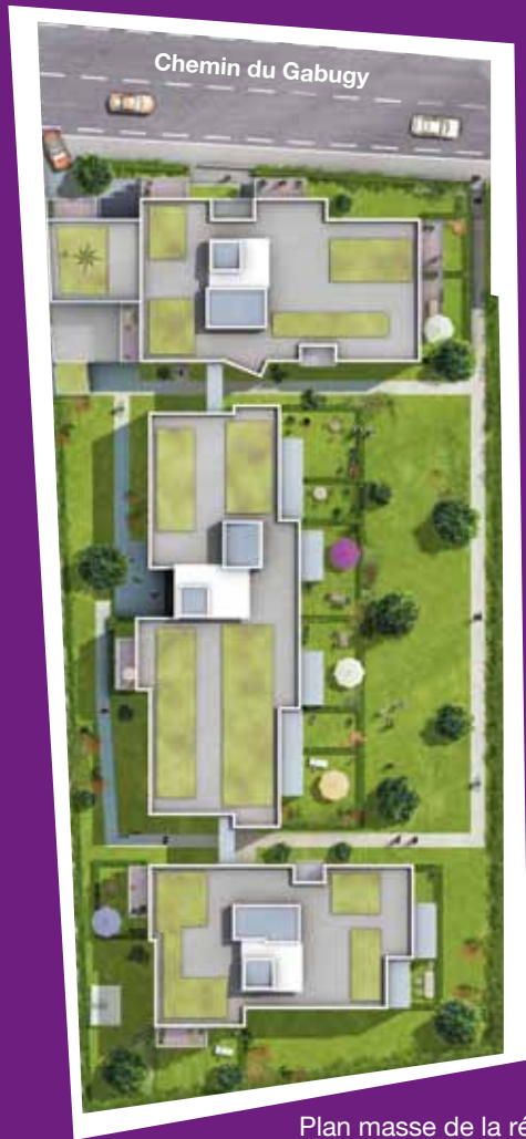
Plan masse de la résidence

104-106 Chemin du Gabugy à Vaulx-en-Velin