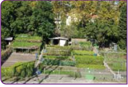
Quartier du Pont des Planches.

Le bien-être dans un lieu aux atouts uniques