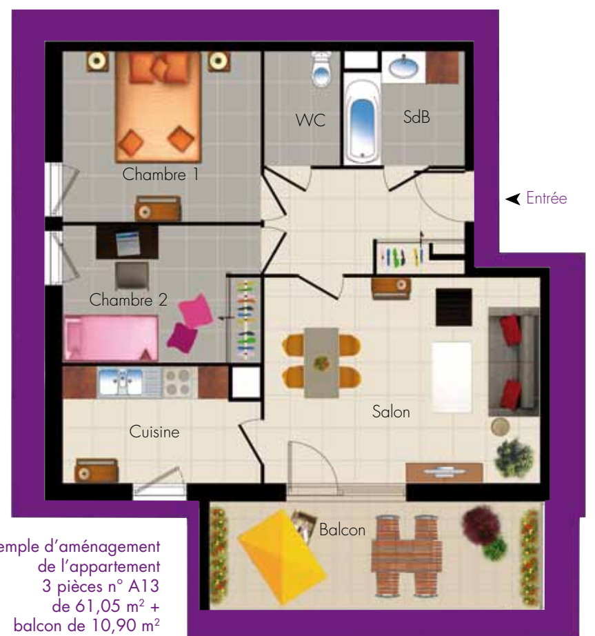
Exemple d'aménagement de l'appartement 3 pièces n° A13 de 61,05 m 2 + balcon de 10,90 m 2

Tout a été pensé pour que vous viviez ici à votre rythme et selon vos moyens, en toute tranquillité.