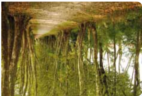
Bords de Rize.